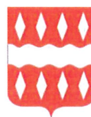
Commune de Viroinval